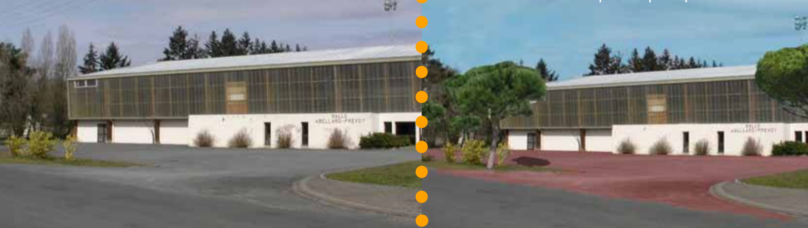
Entrée salle omnisports après plantation